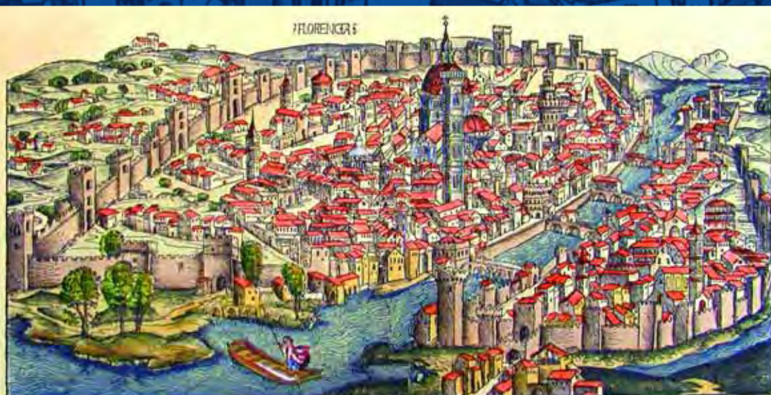
View of Florence, printed in Nuremberg in 1493.