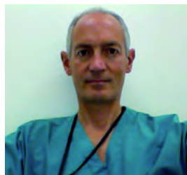
Presidente del Congresso